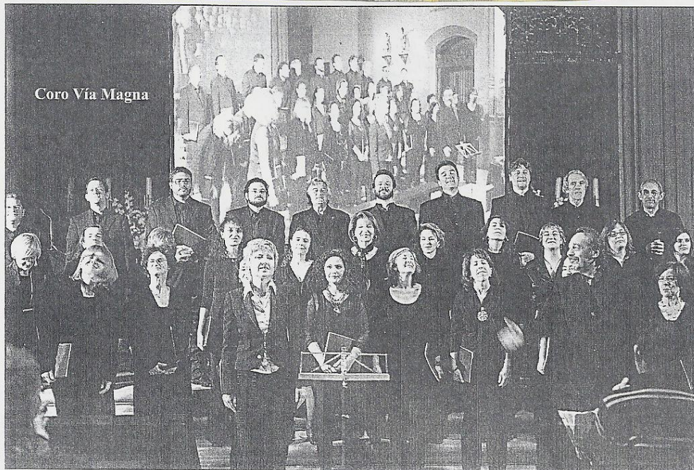
Coro Vía Magna

Número 2.192 :-:18 de junio de 2011 :-: AÑO 43 :-: 1,20 euros