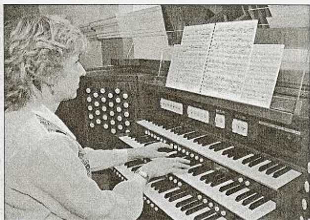
Iglesia de Sant Carles de Ibiza

Es la organista de la Magistral-Catedral de Alcalá