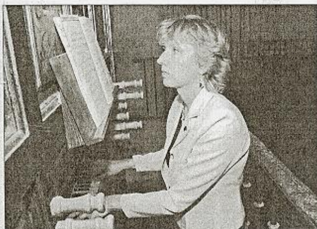
Colegiata de San Pedro en Lerma (Burgos)

Nos alegramos de tener en nuestra Ciudad a esta estupenda organista de origen ruso y nacionalidad española, que está cosechando tantos éxitos profesionales a lo largo de nuestra geografía y en los Países que visita; paseando y representando en sus conciertos a la Catedral de Alcalá de Henares y por tanto a la Ciudad que ha sido cuna de Cervantes.